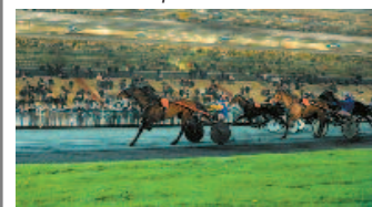
Quinté+ à Vincennes - 20.00