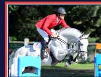
ROCK'N ROLL ANIMAL Quatar de Plapé x Cook du Midour