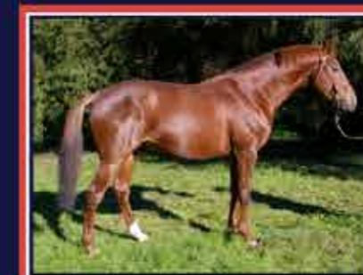
FAIRPLAY DU PECOS Freeland x Safir