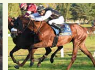
STELLA DE LENZAC Femelle, 37,5 %, élevée par la Famille Reillier. Meilleure pouliche 37,5 % à 3 ans en 2018.