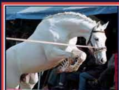
QUATAR DE PLAPE Emir IV x Djecko