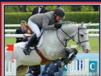
NATHAN DE LA TOUR Fusain du Defey x Faritchou