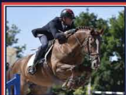
MILOR CHAMPEIX Ryon d'Anzex x Tango de Brejoux