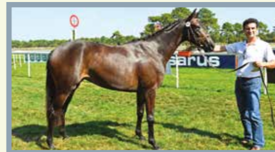
PETITE ROBE NOIRE 1er Femelle 25 à 37,5 %. Last Train x Famous du Pecos