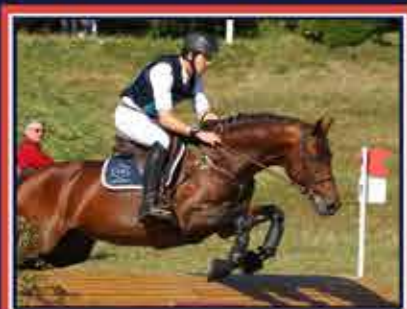
CESTUY LA DE L'ESQUES King Size x Ultan