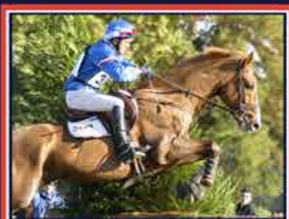
EERSTELING DU LEOU Féticheur x Garitchou