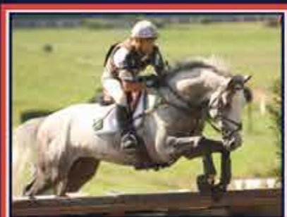
QUERDOLAN VITAREL Défi d'Armenti x Dairin