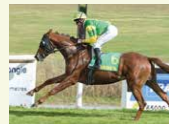
FEELING DU PÉCÓS Mâle, 50 %, élevé par le Haras du Pécós. 13 courses, 2 victoires et 10 places. Gagnant du Prix du Ministère à Tarbes à 3 ans.