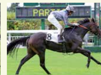
OR ET NOIRE Femelle, 25 %, élevée par Benoît Lapèze-Charlier. 8 victoires dont le Grand Prix des AA à Saint-Cloud en 2017.