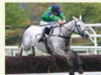
FIASCO DU PÉCÓS Hongre, 12,5 %, élevé par le Haras du Pécós, 13 courses, 3 victoires et 8 places en obstacles. Gagnant à Auteuil du Steeple-Chase National à 5 ans et du Prix Chincó à 6 ans.