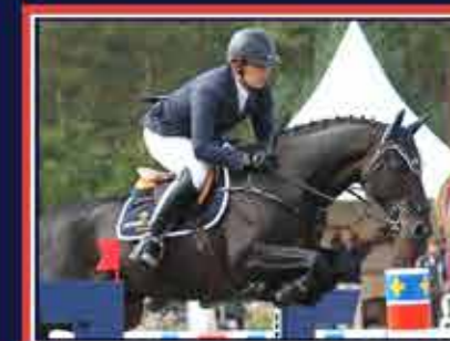
OLALA DE BUISSY Cook du Midour x Laudanum