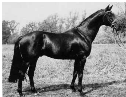
Matcho (Pancho II)