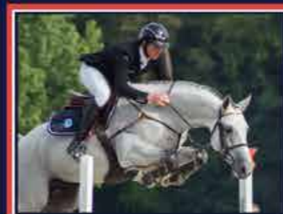
UPSILON Canturo x Fusain du Defey