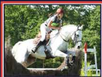
ARANWE VITAREL Popayann x Jalienny