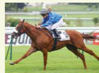
SHREK Mâle, 12,5 %, élevé par Michel Parreau-Delhote. 10 courses, 2 victoires et 7 places. Gagnant du Grand Prix des AA à Longchamp à 3 ans. Etalon.

Depuis sa création, ce concours voit passer les meilleurs sujets de la race anglo qui s'imposent régulièrement dans les courses de sélection, tant en plat qu'en obstacles.