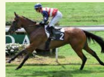
FLAMB'EE Femelle 25 %, élevée par Daniel Lacassagne et Jean-Marc Davezac. 7 courses, 4 victoires et 3 places.