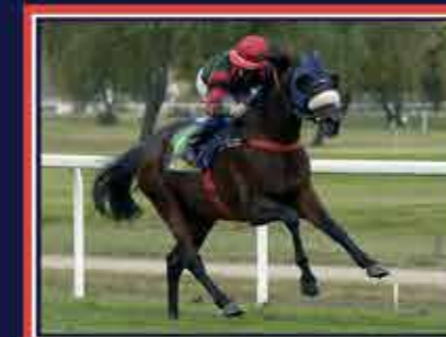
CARGESE DES LANDES Dearling x Fayriland II