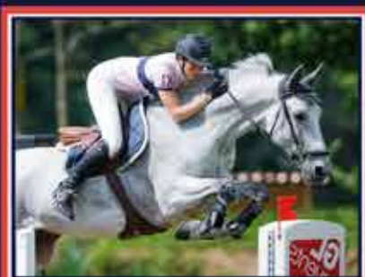
ORIENT DU PY Quatar de Plapé x Prima d'Or