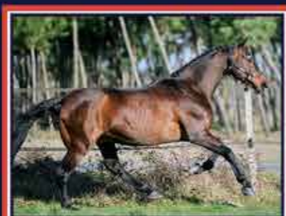
ULTRA DE ROUHET Neptune d'Alary x Nithard