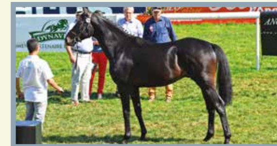
FULLMONTY 1er Mâles et Hongre 12,5 à 25 %. Mister Ful x Lady Aline