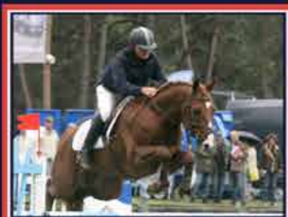
PASTEL D'OLYMPE Fusain du Defey x Markus