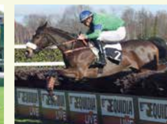
ASTRIDLANDE Femelle, 12,5 %, élevée par Xavière Cauhapé. 7 courses, 4 victoires et 3 places en obstacles. Gagnante de la Coupe à Pau à 3 ans.