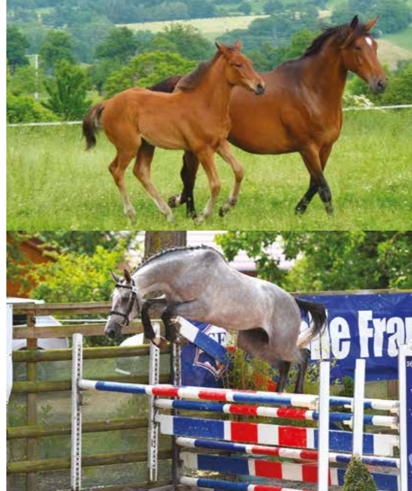
De haut en bas, l'Il Win Domerguie et Flic Enflac Vimaje

Great thoroughbred breeders use to say that one stallion out of 20 has a better production than the average and one out 200 will become a great sire. Leading sires are even more rare. Because of this scarcity, good Anglo-Arabs stallions in German studs have been extremely successful.