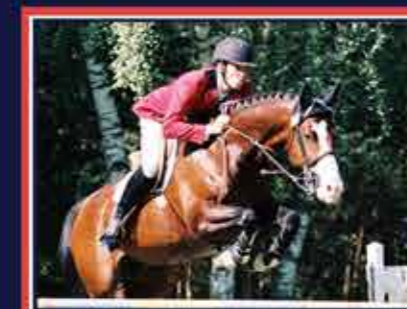
FANGO IN BLUE Véganum x Iago C