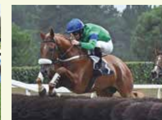
FAIRDJIN PONTADOUR Mâle 18,5 %, élevé par François Maillot, meilleur 3 ans de 12,5 % à 25 % sur les obstacles en 2018.