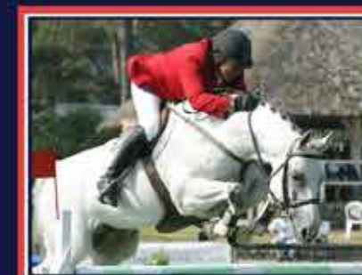
FUSAIN DU DEFEY Phosph'Or x Fol Avril