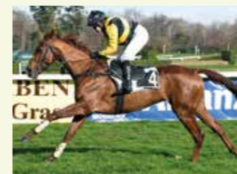
FLINT DU PÉCÓS Mâle 12,5 %, élevé par le Haras du Pécós. Meilleur 3 ans de sa catégorie sur les obstacles en 2018.