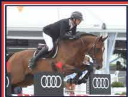
VASNUPIED DE JONKIERE Laurier de Here x Défi d'Armenti