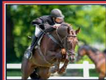
POTTER DU MANAOU Ryon d'Anzex x Rif du Crocq