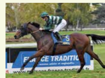
DIVIN DE CAJUS Hongre, 50 %, élevé par Patrice Lozano. Meilleur cheval de sa génération en 2017, 6 courses, 5 victoires et une deuxième place.