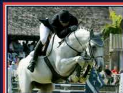
LAURIER DE HERE Véloce de Favi x Samuel