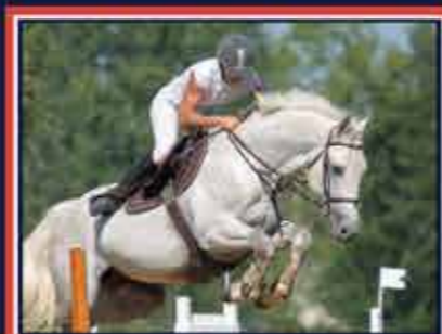
POPAYANN Ryon d'Anzex x Quatar de Plapé