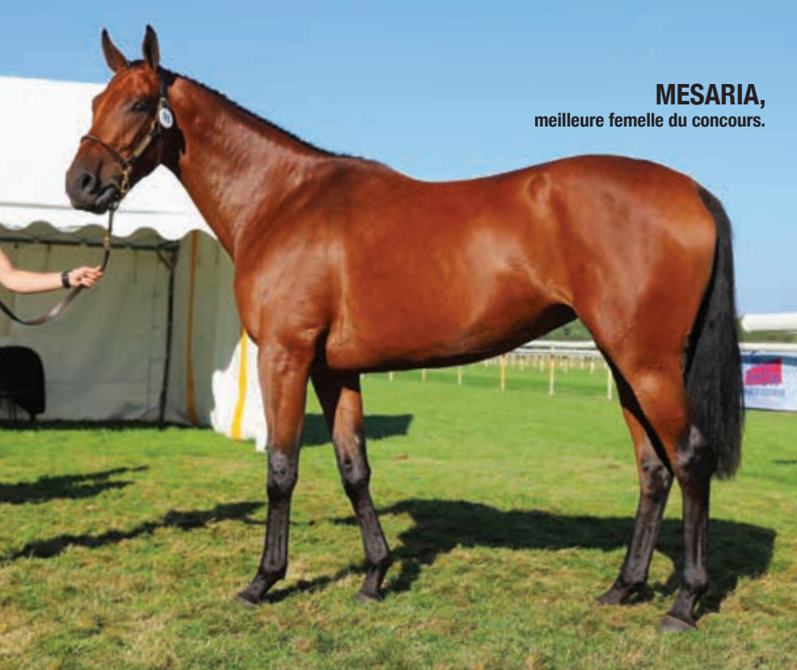
MESARIA, meilleure femelle du concours.