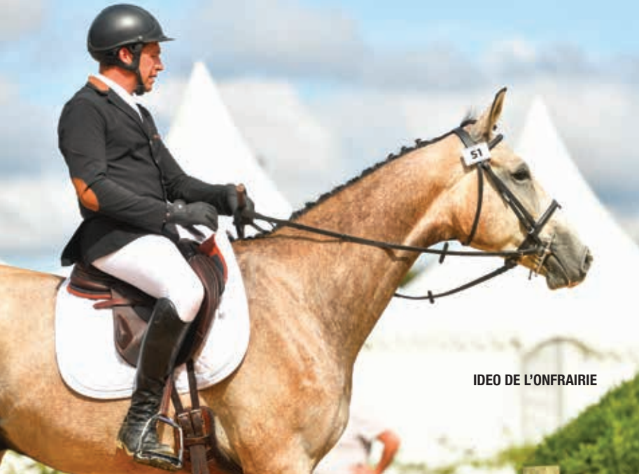
IDEO DE L'ONFRAIRIE

faire le déplacement pour participer au championnat de France AA à Pompadour ?