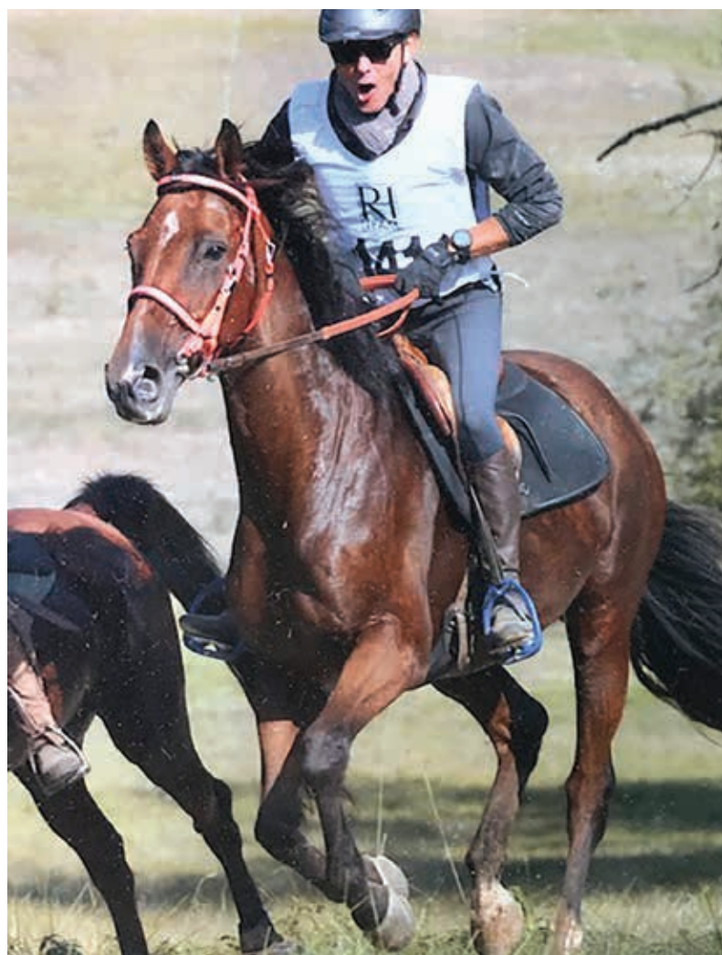
Boston de Béarn

Boston de Béarn AA, 42% par Ivain et Murmure de Béarn par Fusain du Defey, origine typiquement