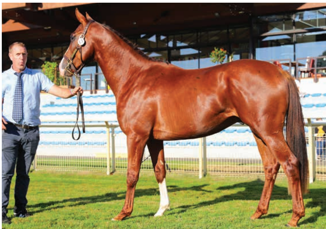
JOCKER DE TANUÈS, meilleur mâle du concours.