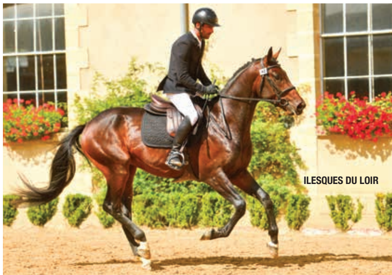
ILESQUES DU LOIR

C'est un fils du bondissant King Size ISO 160 exporté en Sardaigne (par Osier du Maury ISO 151 et l'excellent Barigoule) et de la bonne Gaïa of Ultan ISO 144 fille d' Ultan , un étalon Anglo-arabe produisant bien, amenant de la force et du chic. Gaïa of Ultan est déjà à la tête d'une petite dynastie comptant de nombreux chevaux indicés dont trois à plus de 150 tel que le vaillant Punch de l'Esques (par Hermès d'Authieux AC) CCIO frère utérin du jeune Ilesques du Loir. La souche basse s'avère des plus intéressantes puisqu'il s'agit de celle de Lorette (par Canard Sauvage), un autre classique