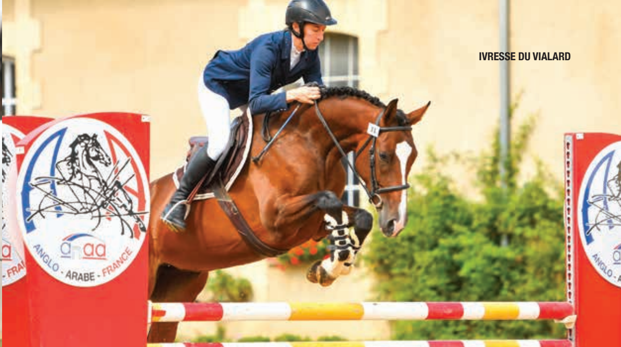
IVRESSE DU VIALARD