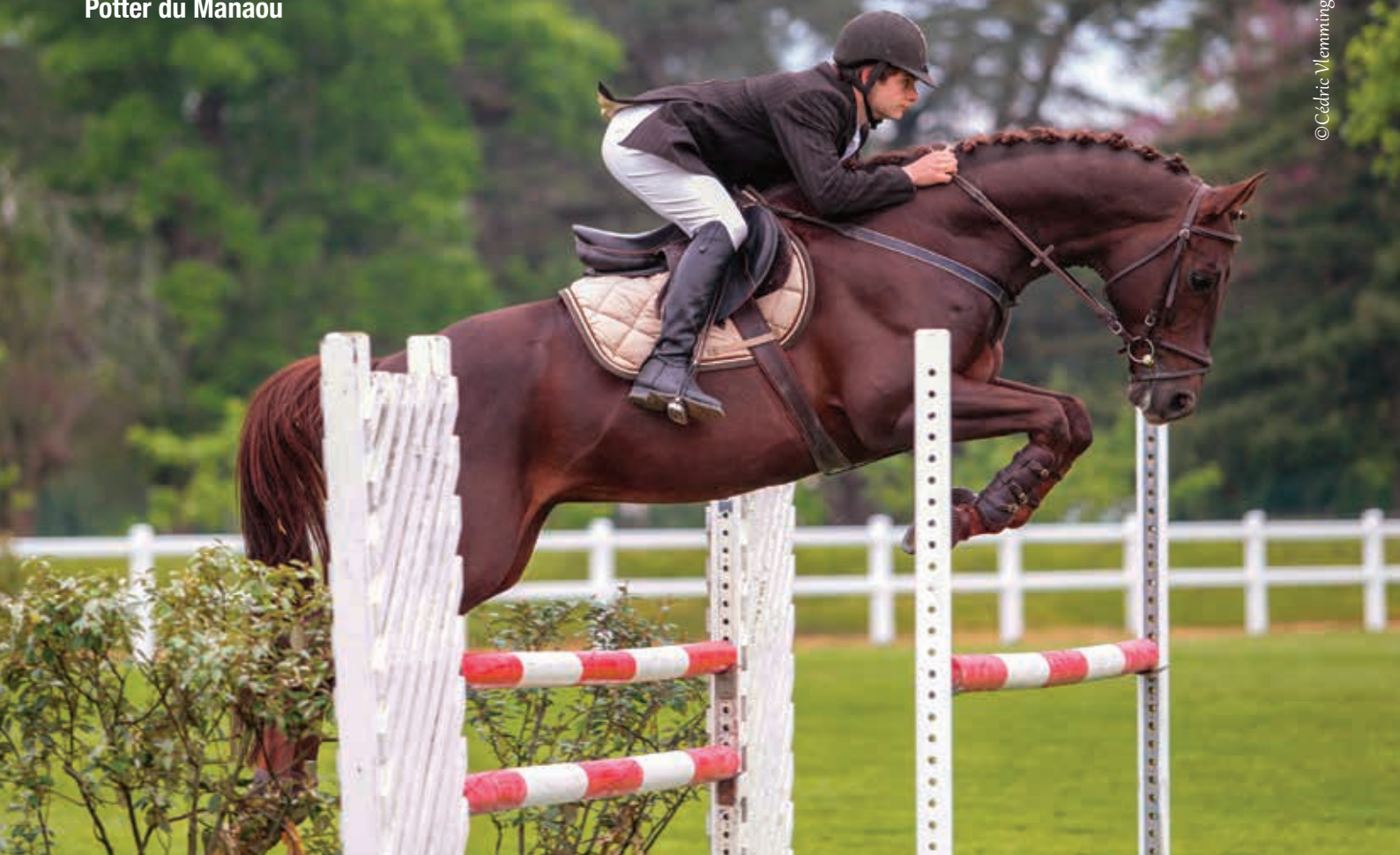
Potter du Manaou