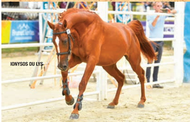
IONYSOS DU LYS