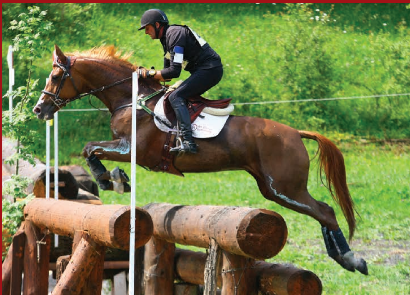
Encore une Medaille, ICC 147

Le choix des éleveurs pour servir ces poulinières est très diversifié, seul Prestige Kalone et Nathan de Latour ont sailli 2 juments, les 6 autres juments se répartissent sur Cestuy La de l'Esques, Fusain du Defey, Cook du Midour, Fandsy, Rock'n roll Animal et Potter du Manaou.