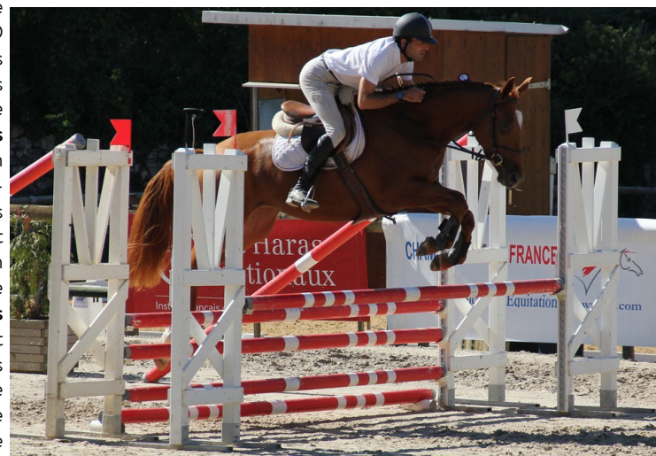
Vadrouille d'Avril à trois ans

Sisqueille, débuté par Thomas Carlile jusqu'en trois étoiles de complet et qui continue son parcours sportif international sous selle japonaise. Dans cette même section Vice Versa d'Ossau (For Pleasure et Cybele d'Ossau par Dairin né chez Patrice de Robillard), sérieux jeune concurrent de l'époque, s'est révélé par la suite en CSO jusqu'en cinq étoiles 150 sous couleurs américaines, ainsi que Valdess des Loges (Jaguar Mail/Ryon d'Anzex né chez Jean-Pierre Bendinelli), plus loin dans le classement qui s'est distingué en classiques 6 ans. Cette même année 2011 Vénus de Chalusse remportait la section des pouliches de 2 ans. Cette fille de Tinka's Boy et Jacote de Chalusse par Fast née chez Solange Planchon,