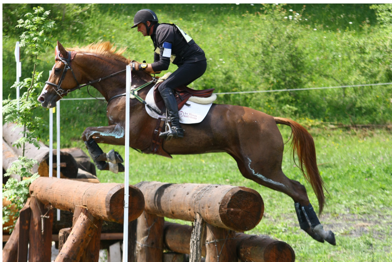
Encore Une Médaille

Quatre bonnes juments sortiront de la promo 2007 : Qahira de Domergue (Geriko du Quercus et Thaours des Bois par Knour de Plaisance née chez Patrick Loudières) et Rustine de la Vaysse (Quercus du Maury et Ettaurie par Ghost Buster's née chez Renée Sturbois) toutes les deux créditées d'un ISO 143. Rhêa du Puy (Gral des Vernières et Doria Combescure par Impulsif A née chez Patrick Viala) sera sacrée championne de France des pouliches de deux ans sport et également à 4 ans lors de la finale cycles classiques à Fontainebleau. Roumia de Brunel (Mokkaido et Dandy de Brunel par Quito de Baussy née chez Sylvie Bataille) sera vice-championne des pouliches de deux ans anglo-arabes de croisement, et par la suite fera une belle carrière sportive particulièrement en Grand prix Pony. L'étalon Querdolan