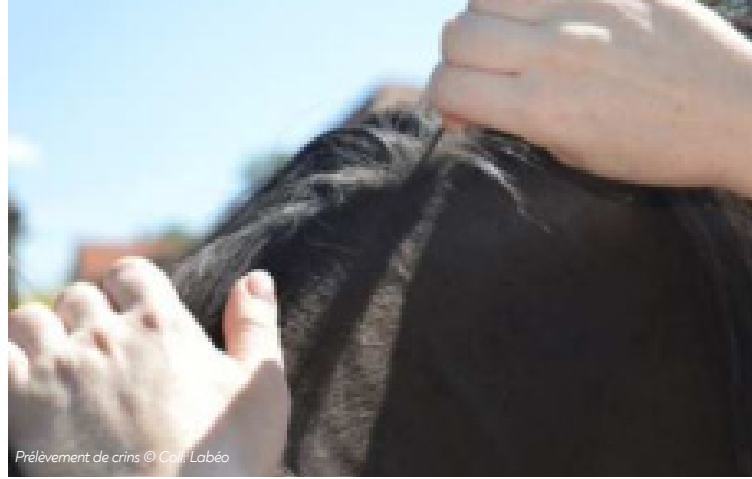
Prélèvement de crins

Concernant l'exercice, le confinement des chevaux atteints est à proscrire et il est important qu'ils aient