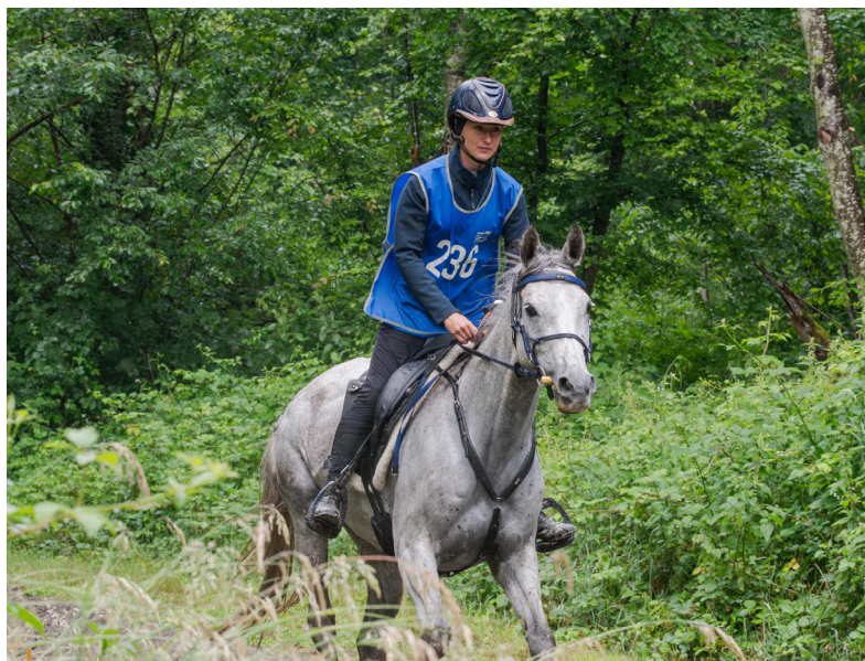
Doha d'Artagnan AA par Sadeper et L'étincelle d'Or par Gnome née chez Jean-Michel Grimal

A noter que Doha d'Artagnan AA représentera la France lors des championnats du monde d'endurance à Monpazier.●