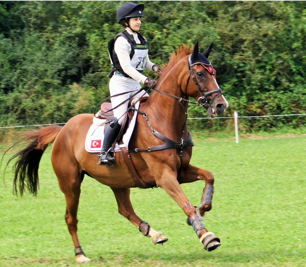
Baladin de l'Océan LA © Isabelle Joye

Les Champions passés en 2014 par les finales ont brillé en complet à l'instar de Baladin de l'Océan LA (Véloce de Favi et Balkame par Noyalo X né à la SARL Equispace), doté d'une souche