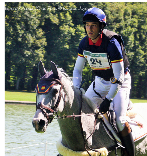
Utrera AA aux JO de Paris

Chinka's Domergue Par Tilippe Le Bel aa et Hélianthe d'Isle aa par Iago C aa. Finaliste au pentathlon moderne sous selle allemande.