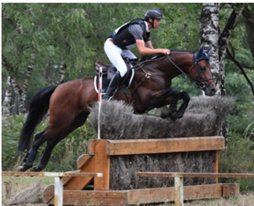
Cestuy La de l'Esques