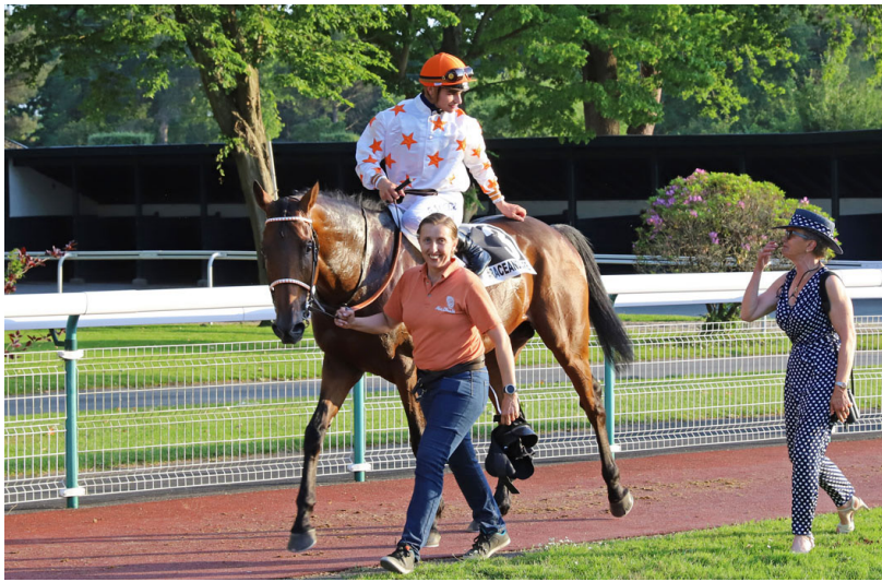
Elektrik Jim AA, meilleur cheval de plat chez les 4 et 5 ans 12.5 à 37.5% en 2023

Show Anglo Course est en effet un événement en tout point convivial, avec notamment son cocktail de bienvenue et sa soirée de l'élevage la veille puis son déjeuner-buffet le jour du concours. Mais aussi un événement à destination de tous les éleveurs qui, quelle que soit la taille de leur effectif et leur situation géographique, sont incités à présenter leurs pouliches et poulains anglo-arabes de 2 ans à des socio-professionnels (propriétaires, entraîneurs, courtiers, etc.) venant de tout le continent pour la plupart, mais aussi d'autres contrées où l'anglo-