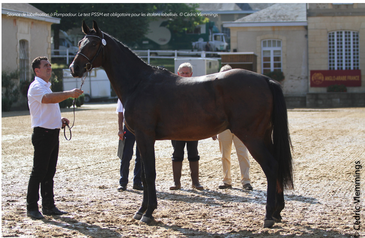
Séance de labellisation à Pompadour. Le test PSSM est obligatoire pour les étalons labellisés.

Le diagnostic de la maladie repose sur l'analyse histologique d'un échantillon de muscle prélevé par biopsie. Bien qu'il puisse être intéressant de réaliser un dosage des enzymes musculaires, les augmentations de ces paramètres sont inconstantes et ne peuvent donc à elles seules permettre un diagnostic de certitude. Par ailleurs, il semblerait que chez les chevaux près du sang, cette augmentation