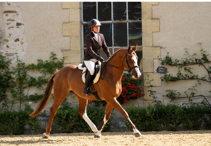
Bellaigio Declyange à trois ans