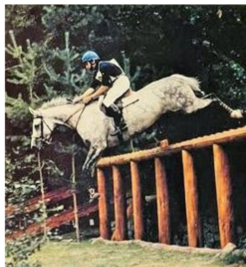
Ensorceleuse II